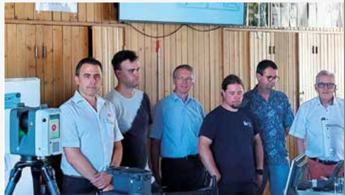
Baden-Württemberg mit seinem Team für Nachwuchsgewinnung beim Lessing-Gymnasium in Karlsruhe