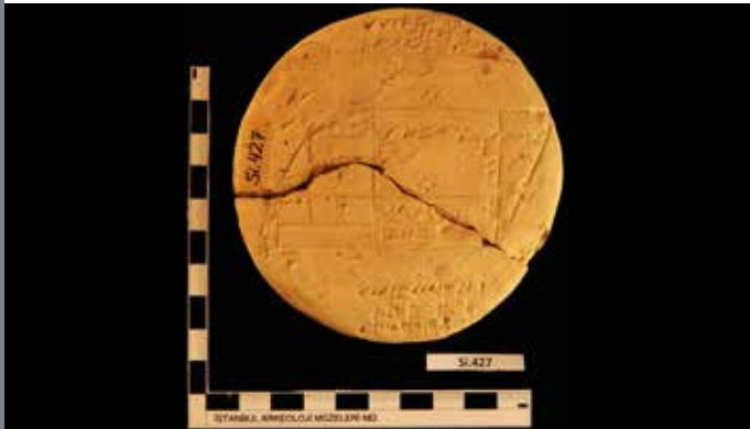
Die Vorderseite der Tontafel Si. 427 S. 390