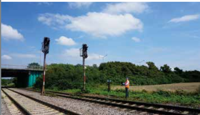
3D-Scannen von Eisenbahn-Lichtsignalen S. 410