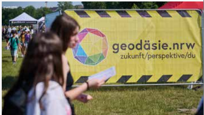
Nachwuchsgewinnung auf dem Erlebnistag Geodäsie in Düsseldorf