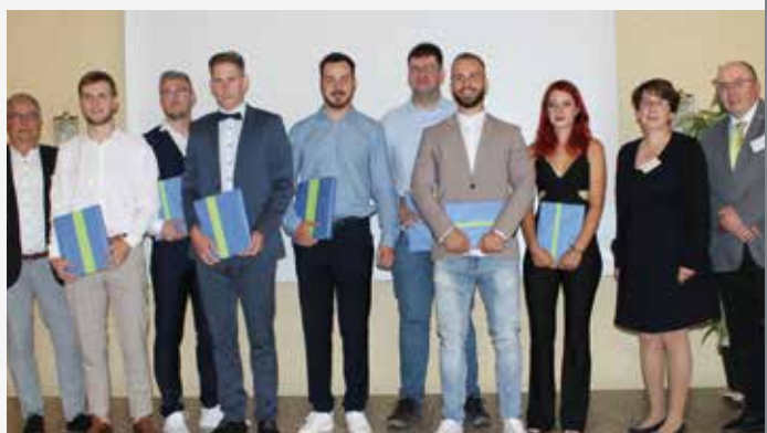
Die prüfungsbesten Vermessungstechniker/innen und Geomatiker/innen in Sachsen-Anhalt